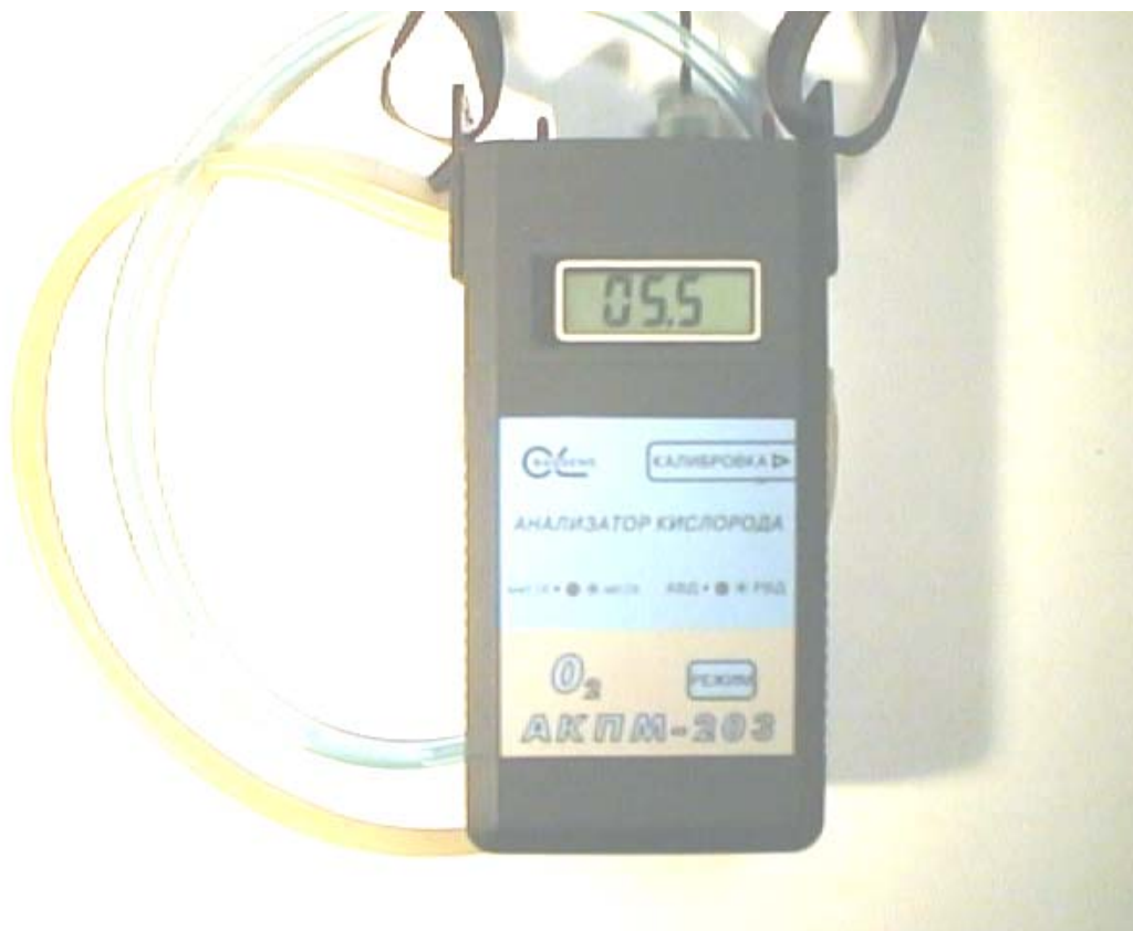
Внешний вид анализатора кислорода АКПМ-02-03